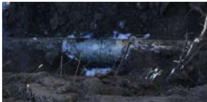
Gescheurde AC leiding als gevolg van de aanleg van een gestuurde boring.